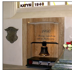
Monumento de sovetiana krimo en Katyn, kie en la jaro 1940 sovetianoj murdis 22 500 polajn oficirojn