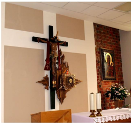
Kapelo en Notre Dame