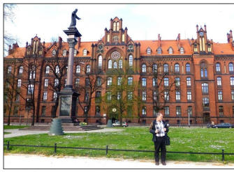
Metropolita Alta Porpastra Seminario en Vroclavo