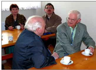
Neformala diskuto dum kafuma paŭzo