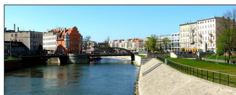
Kajo de la rivero Odra