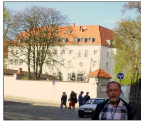
Domo Notre Dame