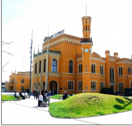
Ĉefa fervojstacidomo en Vroclavo (Wrocław Główny)