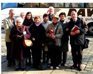
Grupo de kelkaj partoprenantoj