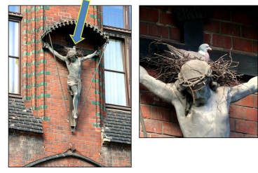
Kolomba nesto sur statuo de Kristo