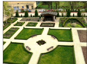
Ĝardeno de Notre Dame