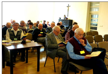
Kantado laŭ kantaro Adoru