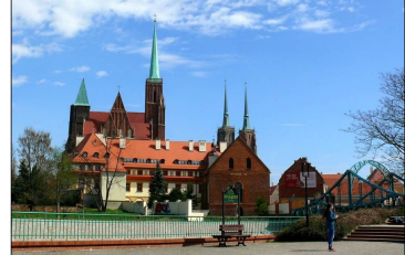
Preĝejo de Sankta Kruco kaj Katedralo de Sankta Johano Baptisto