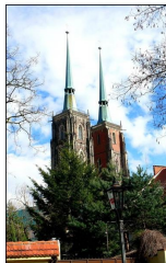
Katedralo de Sankta Johano Baptisto